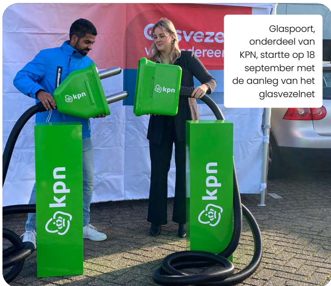
Glaspoort, onderdeel van KPN, startte op 18 september met de aanleg van het glasvezelnet